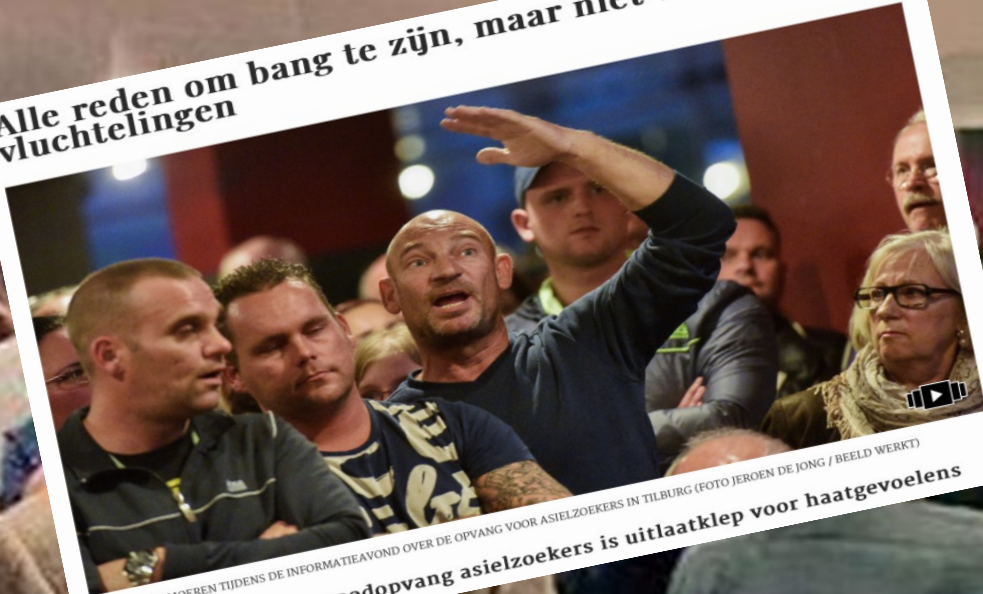
VERHITTE GEMOEREN TIJDENS DE INFORMATIEAVOND OVER DE OPVANG VOOR ASIELZOEKERS IN TILBURG Inspraakavond over noodopvang asielzoekers is uitlaatklep voor haatgevoelens

Alle reden om bang te zijn, maar niet voor vluchtelingen