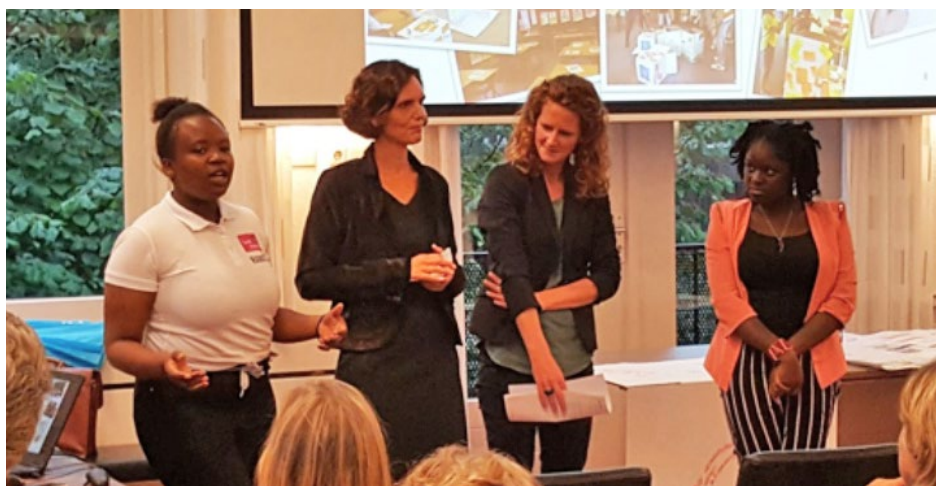
De adviesvangers aan het woord tijdens de radenavond van 30 augustus.

Klik hier voor het interactieve digitale magazine.