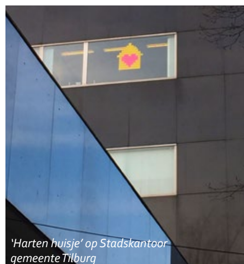
'Harten huisje' op Stadskantoor gemeente Tilburg

Johnny de Mol startte als ambassadeur van stichting Het Vergeten Kind een guerilla actie waarmee hij bedrijven en organisaties in Nederland opriep om mee te doen met een post-it campagne. Met deze post-its werd een geel huis gevormd met daarin een groot roze hart als symbool dat kinderen niet worden vergeten.